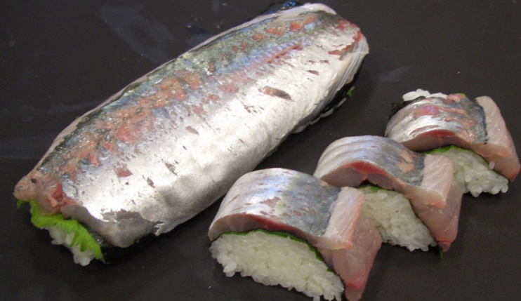
大羽とのりをはさんだ棒寿司も旨い!