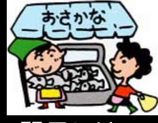
翌日には お客様の お手元に