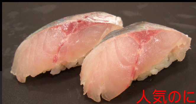
人気のにぎり寿司