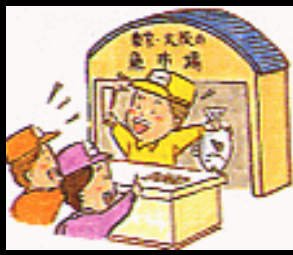
夜10時 築地市場到着