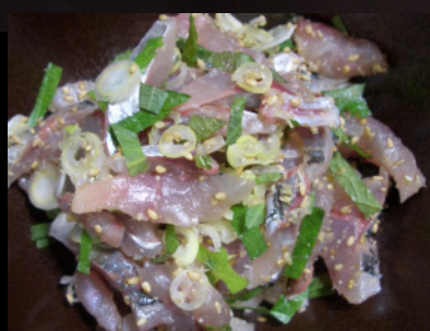
薄造り、姿造り タタキにも