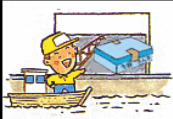
入札後 荷造り出荷